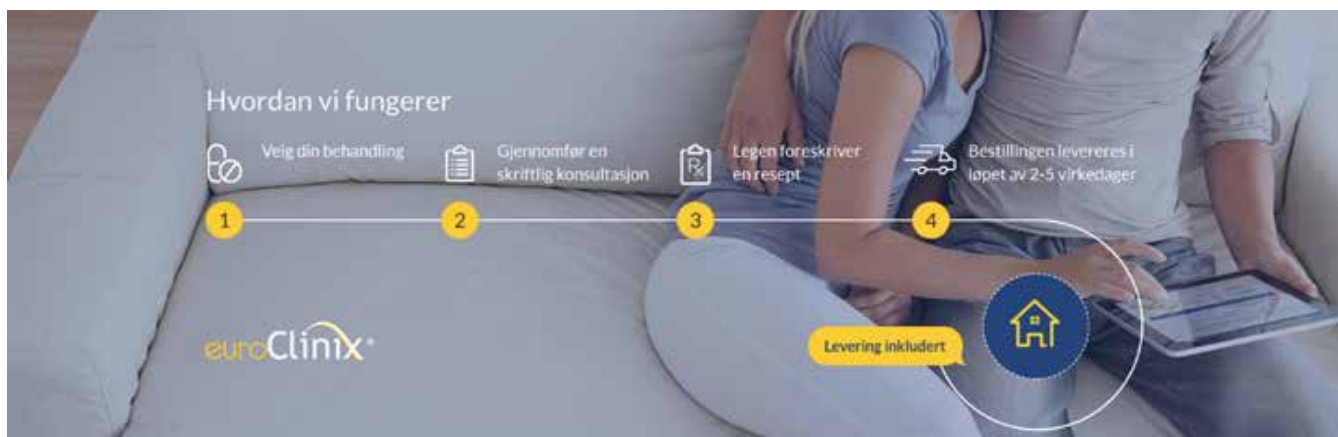
Skjermdumper fra euroclinix.net.