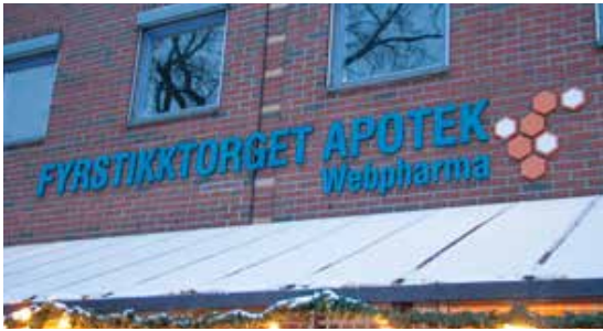
Fra Fyrstikktorget apotek kan du som pasient bestille en resept online og hente ut legemidler uten ytterligere helsekontroll